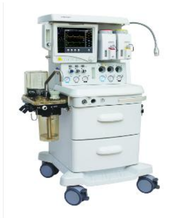
Anesthesia machine AM852