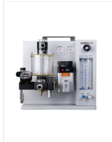
Anesthesia machine AM852V