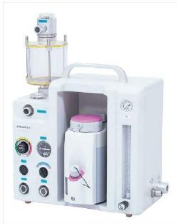
Anesthesia machine AM852P