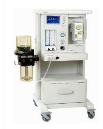
Anesthesia machine AM832-A