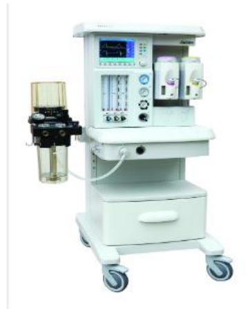
Anesthesia machine AM834