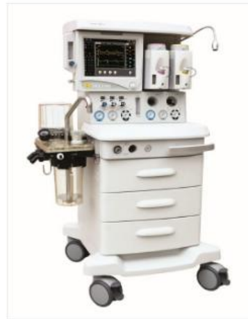
Anesthesia machine AM852-A