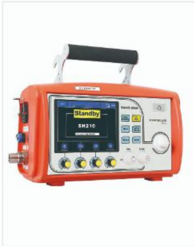
Portable Emergency Ventilator