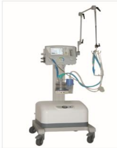
Neonate Ventilator NCPAP SH180