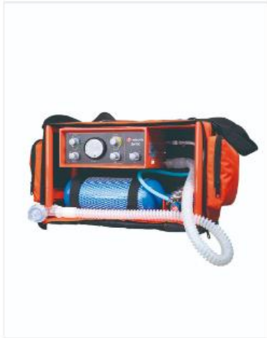
Portable Ventilator SH100