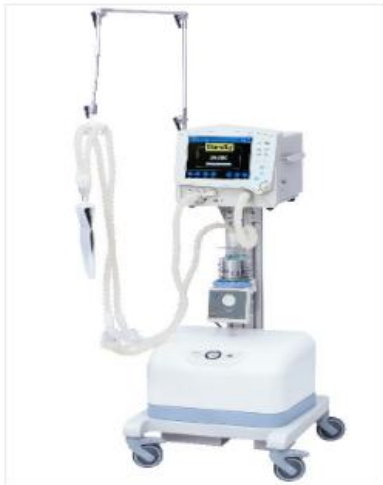
ICU Ventilator SH300 Plus