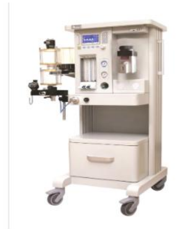
Anesthesia machine AM832